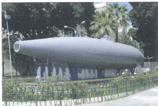
Reproducción del submarino que diseñó Isaac Peral (Cartagena).